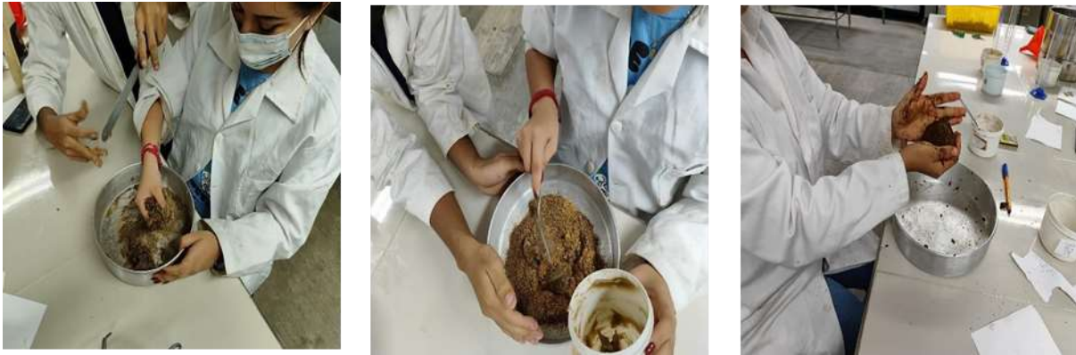
Figura 1. Mezclado de las diferentes formulaciones.