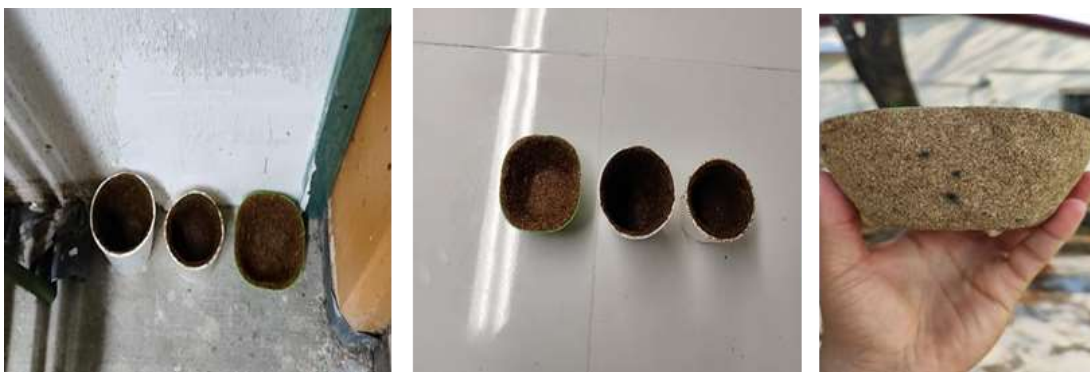
Figura 2. Secado y desmolde las macetas.

presentar deformaciones, grietas o contracciones bruscas, este período de tiempo se determinó con base en pruebas preliminares. Posteriormente las macetas fueron sometidas en horno de convección a 60 °C por 24 horas para obtener una estructura firme y estable, esto permitió la eliminación de la humedad residual teniendo como resultado una estructura firme y estable. Este proceso combidado de tiempo y temperatura obedece a la necesidad de equilibrio en la reducción controlada de la humedad, estabilidad estructural y eficiencia operativa del proceso.