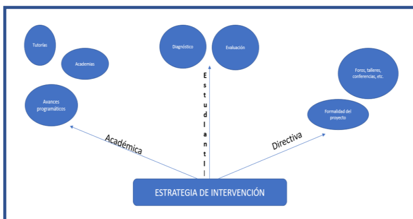
Figura 3. Estrategia de intervención.

En la Figura 3 se muestra la estrategia, que abarca dos grandes dimensiones: la académica y la directiva, apoyada por alumnos en el papel de evaluadores en sus diversas etapas: diagnóstico, implementación y evaluación final.